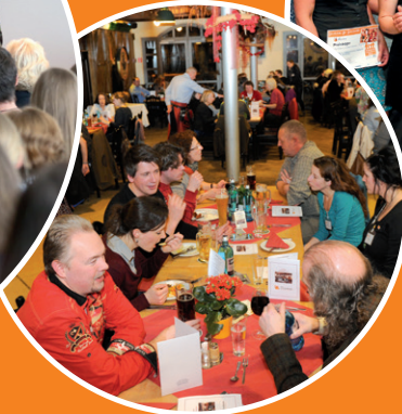
Vergabe des Förderpreises (Abb.: Förderpreisträger/innen 2015)

Tagungsort: Novartis Nürnberg Roonstraße 25 90429 Nürnberg