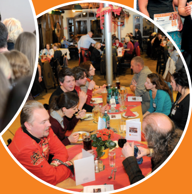
Vergabe des Förderpreises (Abb.: Förderpreisträger/innen 2015)

Tagungsort: Novartis Nürnberg Roonstraße 25 90429 Nürnberg