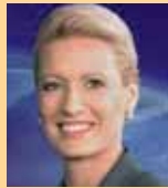
Claudia Kleinert, TV-Wettermoderatorin