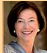
Eva Louise Köhler, Gattin des ehemaligen Bundespräsidenten