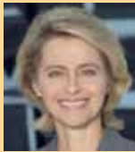
Dr. Ursula von der Leyen, Bundesverteidigungsministerin