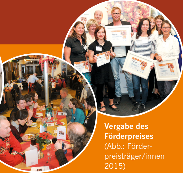
Vergabe des Förderpreises (Abb.: Förderpreisträger/innen 2015)

Tagungsort: Novartis Nürnberg Roonstraße 25 90429 Nürnberg