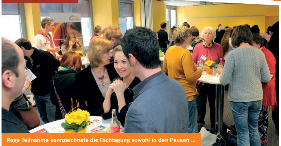
Rege Teilnahme kennzeichnete die Fachtagung sowohl in den Pausen ...