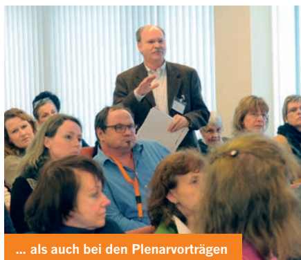
... als auch bei den Plenarvorträgen

In einer Podiumsdiskussion erörterten betroffene Geschwister, Eltern und Experten, welche Bedeutung die für →